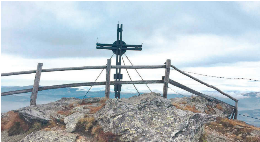
Am Ziel: das Gipfelkreuz des Peterer Riegel